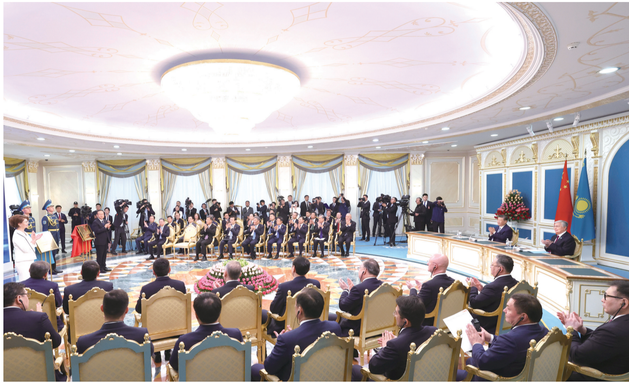
当地时间7月3日中午,国家主席习近平同哈萨克斯坦总统托卡耶夫在阿斯塔纳总统府共同出席阿斯塔纳中国文化中心、北京语言大学哈萨克斯坦分校揭牌仪式。