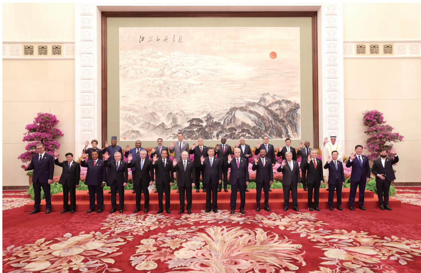
10月18日上午,国家主席习近平在北京人民大会堂出席第三届“一带一路”国际合作高峰论坛开幕式并发表题为《建设开放包容、互联互通、共同发展的世界》的主旨演讲。这是会前,习近平同出席高峰论坛的外方国家元首、政府首脑和国际组织负责人等贵宾集体合影。

新华社北京10月18日电(记者 涂铭 孙奕)10月18日上午,国家主席习近平在人民大会堂出席第三届“一带一路”国际合作高峰论坛开幕式并发表题为《建设开放包容、互联互通、共同发展的世界》的主旨演讲。习近平宣布中国支持高质量共建“一带一路”的八项行动,强调中方愿同各方深化“一带一路”合作伙伴关系,推动共建“一带一路”进入高质量发展的新阶段,为