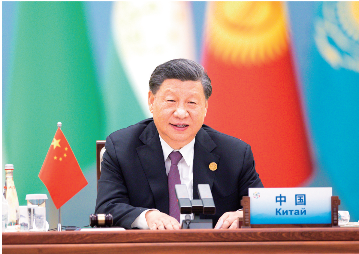
5月19日上午,国家主席习近平在陕西省西安市主持首届中国-中亚峰会并发表题为《携手建设守望相助、共同发展、普遍安全、世代友好的中国-中亚命运共同体》的主旨讲话。