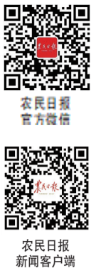
农民日报 官方微信