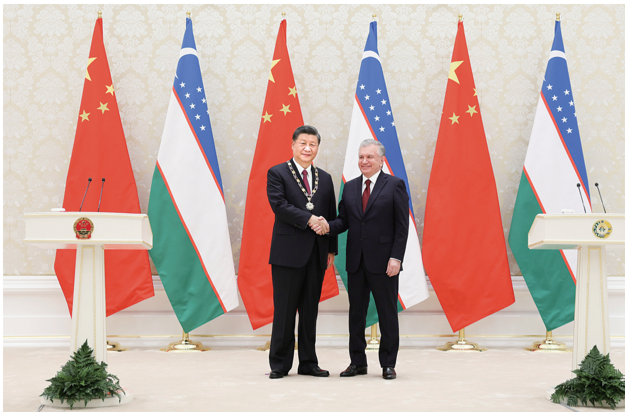
当地时间9月15日,国家主席习近平在撒马尔罕国际会议中心接受乌兹别克斯坦总统米尔济约耶夫授予“最高友谊”勋章。