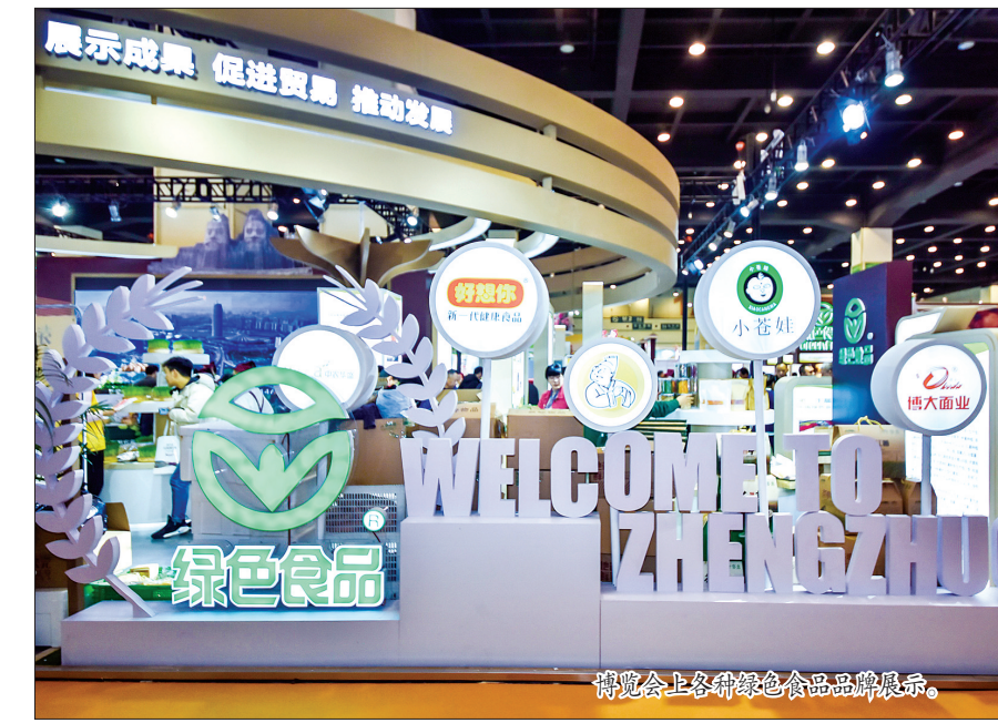
博览会上各种绿色食品品牌展示。