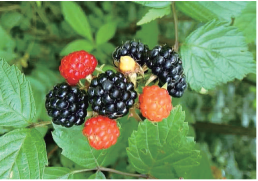
山果熟了