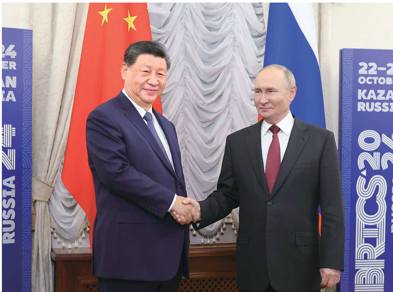
当地时间10月22日下午，国家主席习近平在喀山克里姆林宫同俄罗斯总统普京举行会晤。

新华社俄罗斯喀山10月22日电(记者 郝薇 黄河)当地时间10月22日下午，国家主席习近平在喀山克里姆林宫同俄罗斯总统普京举行会晤。 习近平指出，今年是中俄建交75周年。75年来，中俄关系风雨兼程，探索出“不结盟、不对抗、不针对第三方”的相邻大国正确相处之道。双方秉持永久睦邻