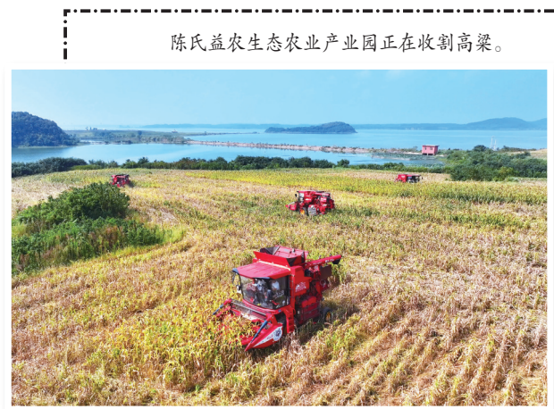
陈氏益农生态农业产业园正在收割高粱。