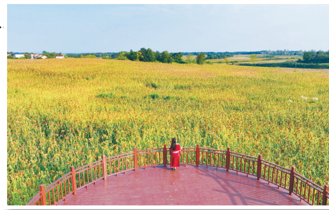
舒安街道徐河片高粱基地。