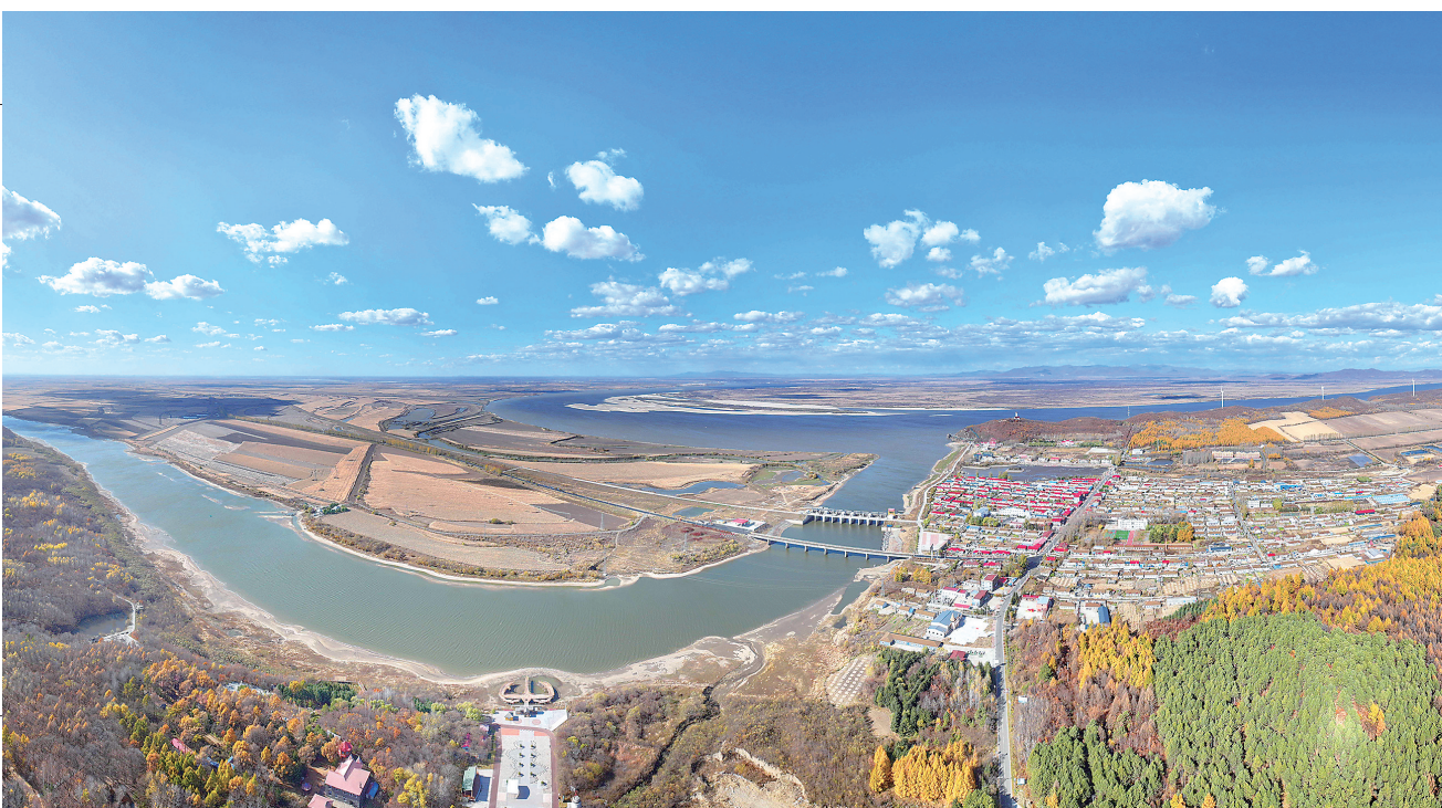
黑龙江省佳木斯同江市街津口赫哲族乡三面环山，一面临水，素有“赫哲故里”的美誉，经济发展以农业为基础，融合渔业、工业、旅游业、畜牧业等，构建多点支撑、多业并举、多元发展的新格局。这是10月12日拍摄的街津口赫哲族风光。