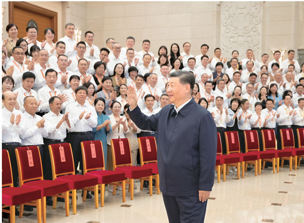
九月九日,党和国家领导人习近平、李强、蔡奇、丁薛祥等在北京接见参加庆祝第四十个教师节暨全国教育系统先进集体和先进个人表彰活动代表。

新华社北京9月10日电 全国教育大会9日至10日在北京召开。中共中央总书记、国家主席、中央军委主席习近平出席会议并发表重要讲话。他强调,建成教育强国是近代以来中华民族梦寐以求的美好愿望,是实现以中国式现代化全面推进强国建设、民族复兴伟业的先导任务、坚实基础、战略支撑,必须朝着既定目标扎实迈进。