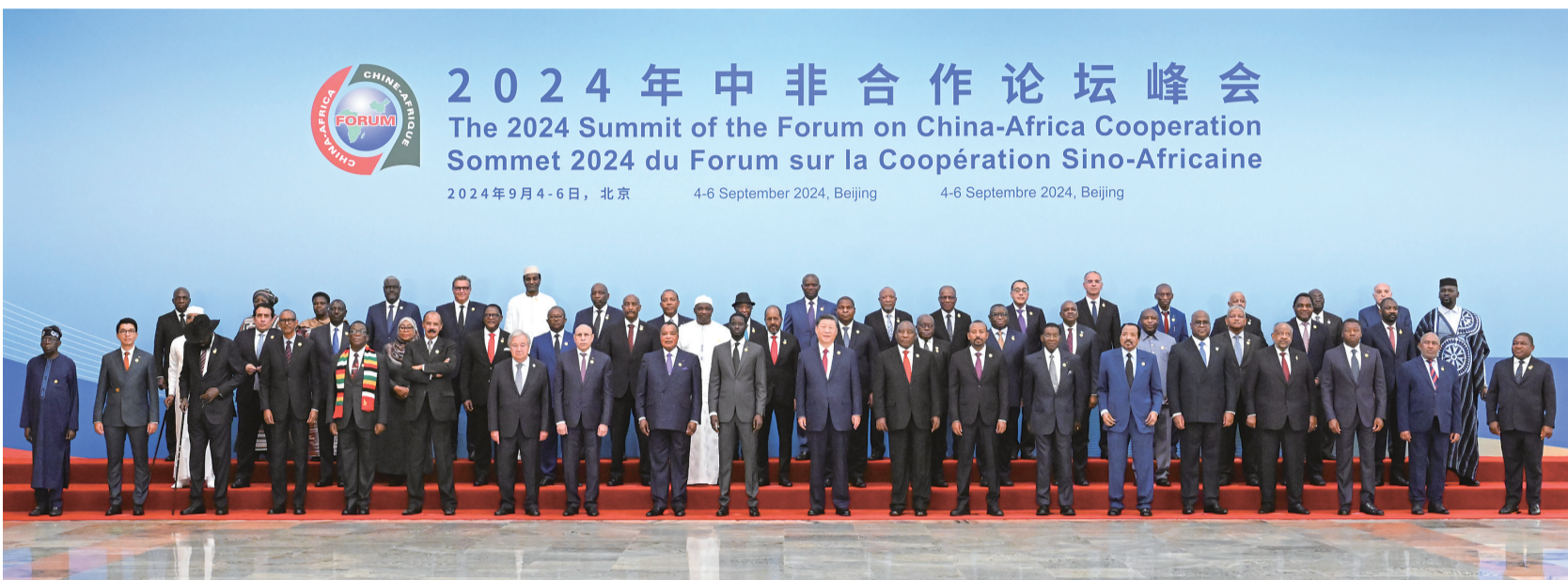
9月5日上午,国家主席习近平在北京人民大会堂出席中非合作论坛北京峰会开幕式并发表主旨讲话。这是开幕式前,习近平同出席峰会的外方领导人集体合影。

新华社北京9月5日电(记者 杨依军 孙奕)9月5日上午,国家主席习近平在北京人民大会堂出席中非合作论坛北京峰会开幕式并发表主旨讲话。习近平宣布,中国同所有非洲建交国的双边关系提升到战略关系层面,中非关系整体定位提升至新时代全天候中非命运共同体,将实施中非携手推进现代化十大伙伴行动。 中共中央政治局常委李强、赵乐际、王沪宁、蔡奇、丁薛祥、李希出席。天安门广场和长安街两侧,鲜艳的五星红旗同53个非洲国家和非洲联盟旗帜迎风飘扬。 习近平同出席峰会的51位非洲国家元首、政府首脑以及2位总统代表、非盟委员会主席和联合国秘书长集体合影。 在《和平—命运共同体》乐曲和热烈掌声中,习近平同外方领导人共同步入会场,在主席台就座。 习近平发表题为《携手推进现代化,共筑命运