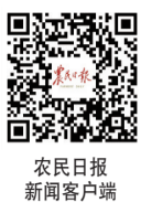
农民日报 新闻客户端