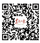
农民日报 新闻客户端

新华社北京8月30日电 8月27日,国家主席习近平复信非洲50国学者,鼓励他们继续为构建高水平中非命运共同体、维护“全球南方”共同利益提供智力支持。