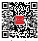
农民日报 官方微信