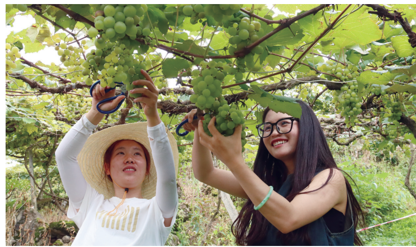
近年来，贵州省三都县积极调整产业结构，走出“生态优先、绿色发展、农文旅融合”新路径。图为当地举行丰富多彩的水晶葡萄旅游文化节，游客前来采摘葡萄。