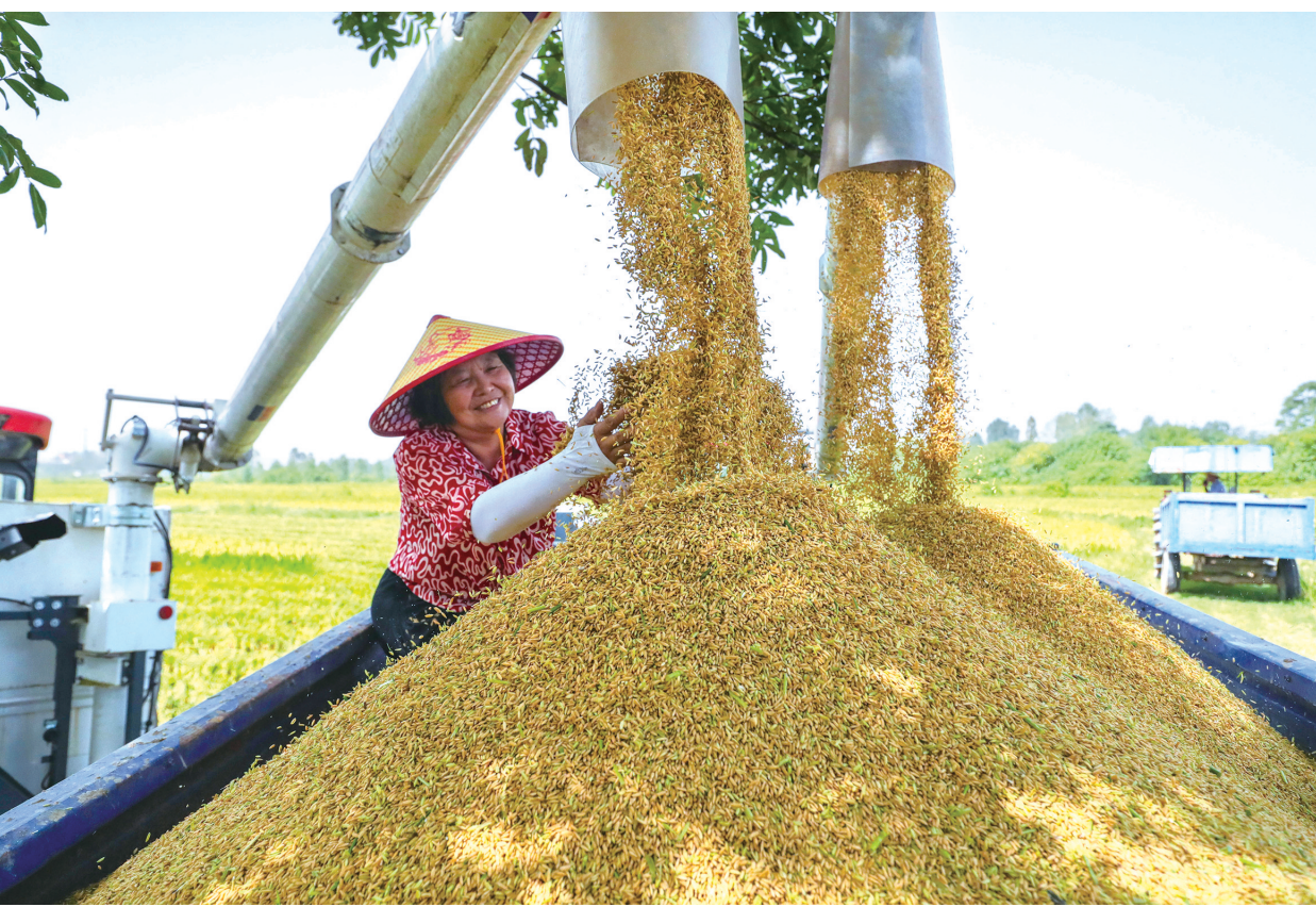
初秋时节，田野稻穗金黄、瓜果飘香，农民忙着收获劳动的果实。图为在河南省信阳市光山县罗陈乡张楼村青龙河合作社，社员在抢收头茬再生水稻。