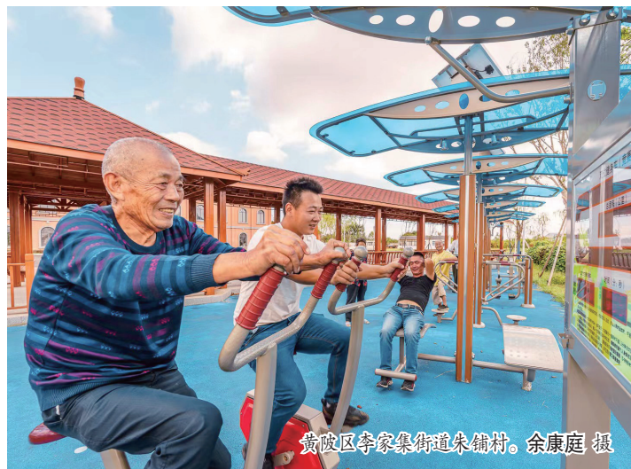
黄陂区李家集街道朱铺村。