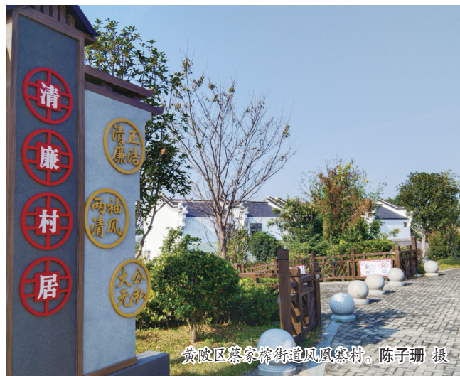
黄陂区李家集街道凤凰寨村。