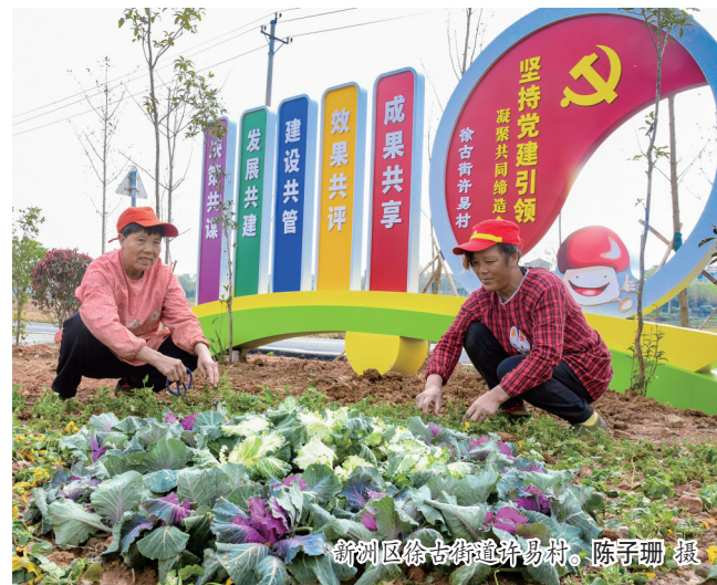
新洲区徐古镇建兴村。