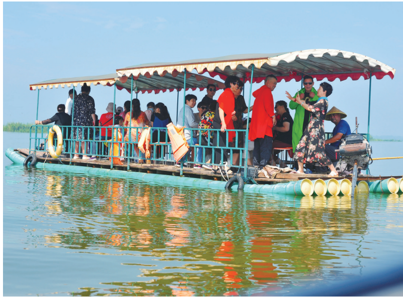
游客在北村村乘坐游船游玩。