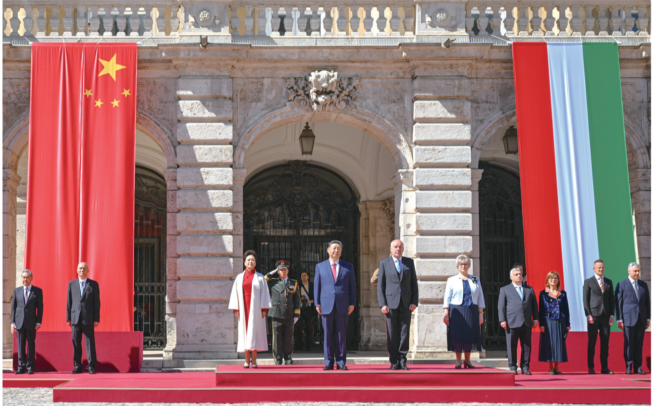
当地时间5月9日上午,国家主席习近平在布达佩斯出席匈牙利总统舒尤克和总理欧尔班共同举行的隆重欢迎仪式。

中方欢迎匈牙利搭乘中国式现代化的发展快车,愿同匈方继续深化政治互信,推动中国式现代化同匈牙利“向东开放”战略更紧密对接,深挖务实合作潜力,持续扩大各领域交流。中方愿同匈方继续引领共建“一带一路”合作和中国-中东欧国家合作正确方向,推动合作走深走实。希望匈方以今年下半年担任欧盟轮值主席国为契机,推动中欧关系平稳健康发展。 舒尤克表示,今年是匈中建交75周年。建交以来,两国始终秉持相互尊重、相互信任的精神发展双边关系。2017年两国建立全面战略伙伴关系以来,双边各领域合作取得积极成果。感谢习近平主席提出共建“一带一路”倡议,使匈方从基础设施互联互通等合作中受益匪浅。习近平主席提出全球发展倡议、全球安全倡议、全球文明倡议,主张加强国际对话合作,这对于解决当前世界面临的各种挑战,防止阵营对抗至关重要,匈方高度评价。加强同中国的合作是匈方既定方针。匈方期待同中方密切交往,加强发展战略对接,推动匈塞铁路等重点合作项目更多造福人民。相信习近平主席这次历史性访问,必将把匈中全面战略伙伴关系提升到新的更高水平。中方在绿色转型、清洁能源等方面拥有先进技术和经验,匈方欢迎更多中国企业来匈投资合作。希望双方继续办好中匈双语学校和孔子学院,加强两国文化交流合作。蔡奇、王毅等出席上述活动。