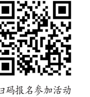
扫码报名参加活动

活动将邀请相关领域专家组成评审小组，制定相关评审细则和规程，对参赛作品进行初评、复评、终评，并通过网络展览展示投票等人气指数综合评判，最终每项评选出一等奖3名、二等奖10名、三等奖15名、优秀奖20名，颁发证书奖金，获奖作品优先进行线上展示展播和在重大活动上推介，对部分优秀作品将不定期进行线下全国巡展巡演。