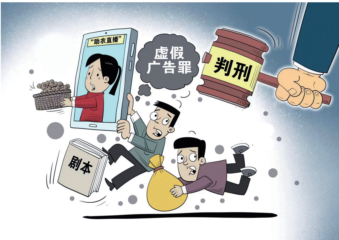
“卖惨”营销 作者：朱慧卿

如今乡村发展日新月异，很多产业都有用人需求，吸引了不少有想法、有能力的大学生返乡就业创业。不过对乡村来说，要想真正留住人才不能光靠情绪价值，而是要在此基础上，通过提高工作岗位的适配度、薪资待遇的竞争力、工作环境的吸引力，让人才能更好发挥才干，愿意留、留得住。