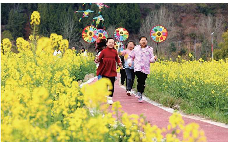
近年来,四川省仁寿县青岗乡积极推动农村改厕、乡村公路等基础设施建设,并发动村民参与油菜花田周边地块整理、环境卫生清理等工作。目前,青岗乡共种植油菜7860多亩,通过发展赏花经济,助力农民增收。因为孩子们在青岗乡盘龙村的菜花坞玩耍。潘建勇 摄

积极组织“四好农村路”系列创建活动,全省累计创建“四好农村路”国家级市域突出单位3个、全国示范县22个、省级示范市5个、省级示范镇56个、省级示范乡镇237个,实现了示范创建省、市、县、乡镇四级覆盖;创建美丽农村路3459.6公里,其中共同缔造试点村建成