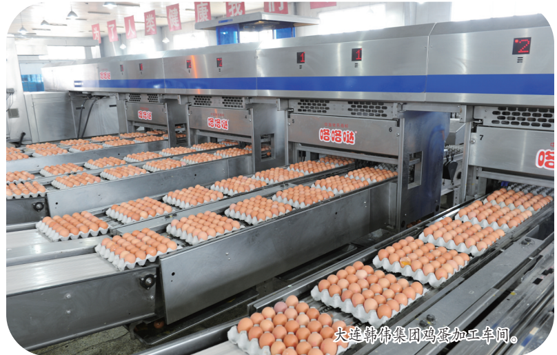
大连锦伟集团鸡蛋加工车间。