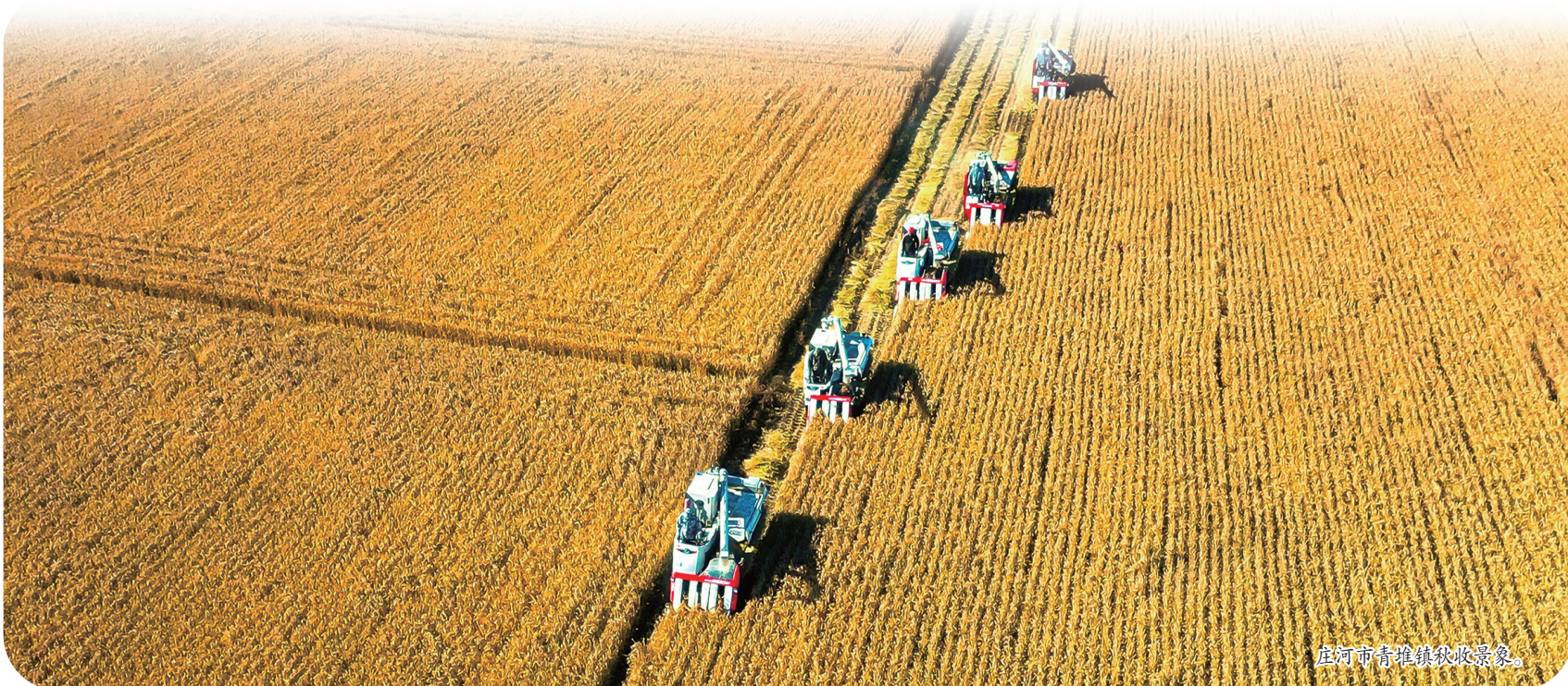
庄河市青堆镇秋收景象。