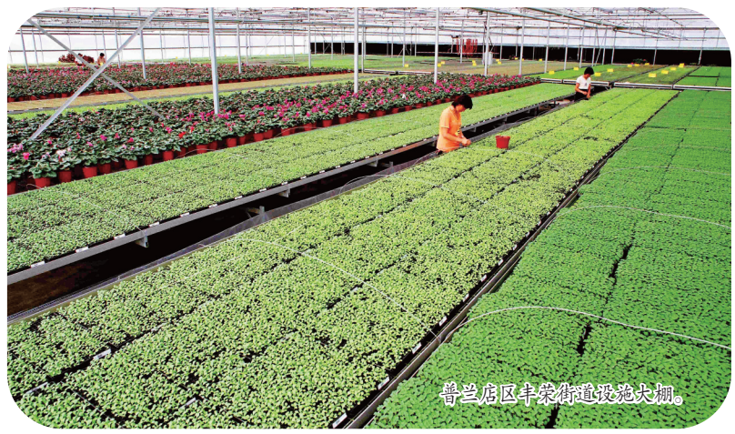
普兰店区丰隆街道建设大棚。