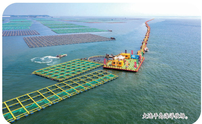
大连平岛海洋牧场。