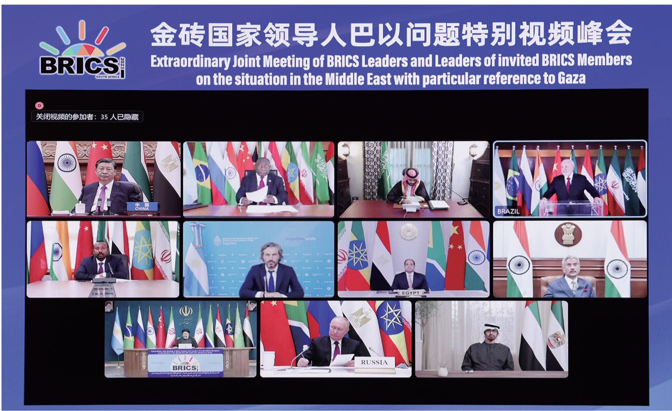
11月21日晚,国家主席习近平出席金砖国家领导人巴以问题特别视频峰会并发表题为《推动停火止战 实现持久和平安全》的重要讲话。

新华社北京11月21日电 11月21日晚,国家主席习近平出席金砖国家领导人巴以问题特别视频峰会并发表题为《推动停火止战 实现持久和平安全》的重要讲话。