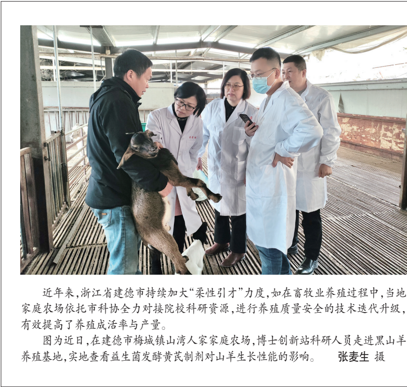
近年来,浙江省建德市持续加大“柔性引才”力度,如在畜牧业养殖过程中,当地家庭农场依托市科协全力对接院校科研资源,进行养殖质量安全的技术迭代升级,有效提高了养殖成活率与产量。

方面进行来凤姜品质等级划分。专家表示,该体系的构建有助于完善来凤姜品质分级分类与标准,建立来凤姜质量管理体系,确保地理标志产品的真实性与独特性。未来,可在分级分类标准完善基础上进行来凤姜种植核心区的划分与保护,来凤姜品质遗传稳定性及遗传改良研究等,“留住”来凤姜的独特风味。