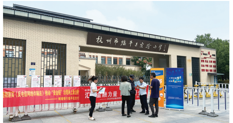
邮储银行杭州临安支行以“汇聚金融力量 共创美好生活”为活动口号,开展金融知识普及宣传。各网点通过电子屏播放活动宣传口号、摆放易拉宝等形式,结合理财沙龙活动、公安反诈工作站建设等,积极对客户进行防范电信网络诈骗,守护财产安全宣传。走进附近社区农居点、临平区实验小学,向周边居民、学生家长普及金融知识,提醒消费者注意保护个人金融信息,提高防范意识,进一步提升人民群众的金融素养。