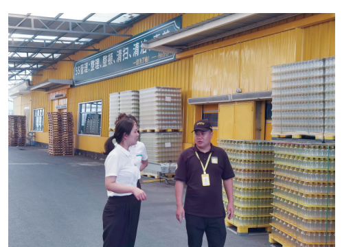
图为衢州分行工作人员实地走访常山恒寿堂果业有限公司，了解公司生产情况。

衢州新农都农副产品集散中心一期于2016年底投入使用，目前已有1000余户商户入驻，2022年，市场总交易量130亿元，总交易量200万吨，有效畅通了浙西地区农产品的交易流通。2017年，农行浙江衢州分行在此新设新设新农都支行，定位为“市场型网点”，服务半径覆盖新农都市场内经营户、衢州市粮食市场、汽车站流动客户、周边社区和附近村庄，在为集散中心商户提供“店门口”的优质金融服务同时，也便利了周边农户。截至目前，该网点服务客户超2800户。