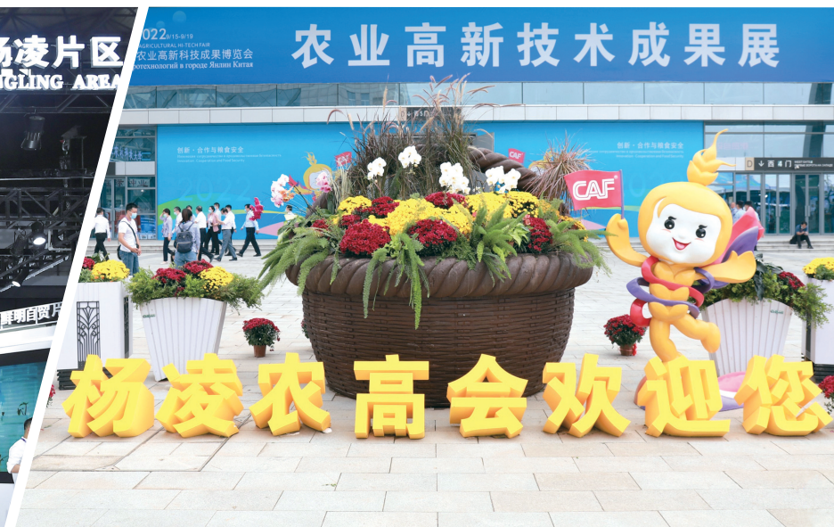
第29届杨凌农高会场外一角。