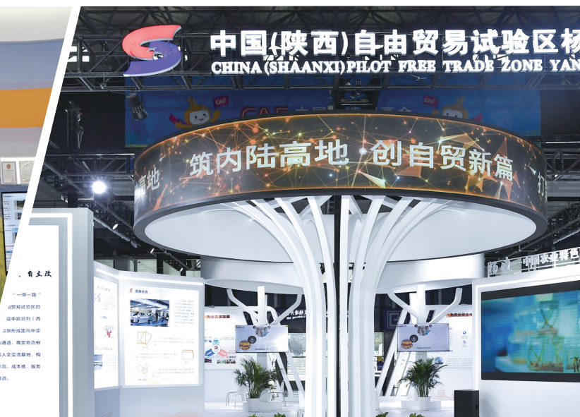
中国(陕西)自由贸易试验区杨凌片区展。