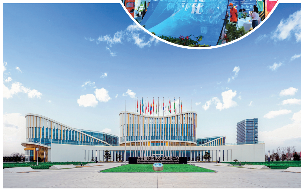
上合组织现代农业交流中心。

别克斯坦塔什干上合组织农业基地中国（陕西）商品交易中心设立展区，展示农业技术及特色农产品、农机农资、生物医药等。