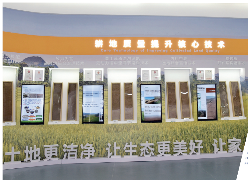
杨凌农高会聚焦土壤健康。