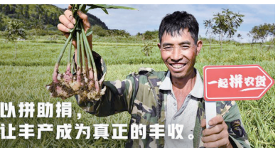
以助增收，让丰收成为真正的丰收。